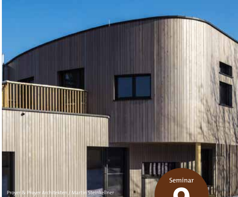
Proyer & Proyer Architekten / Martin Steinkellner