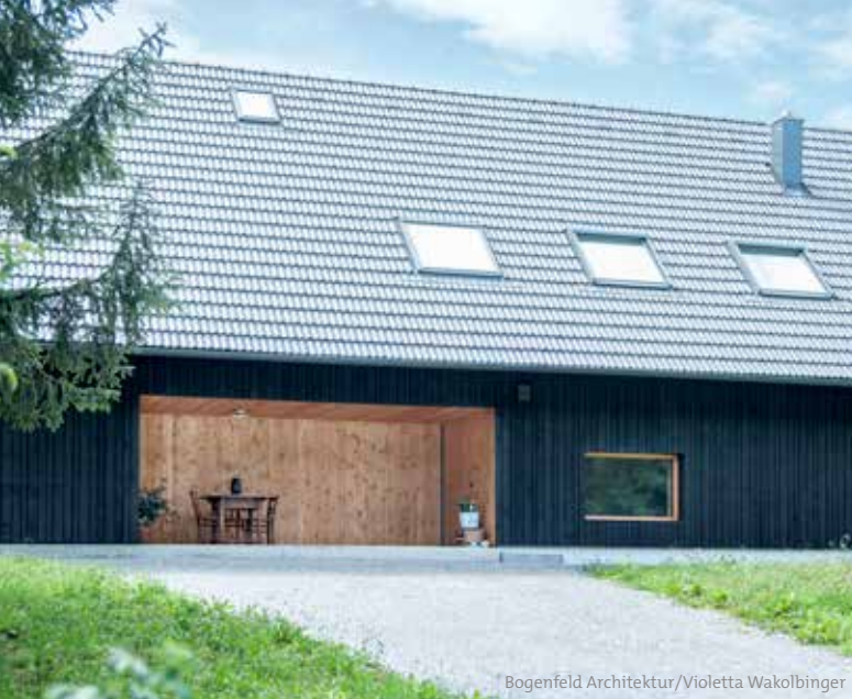
Bogenfeld Architektur/Violetta Wakolbinger