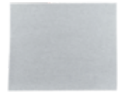
Finishpapier Bogen 3M