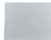
Finishpapier Bogen 3M