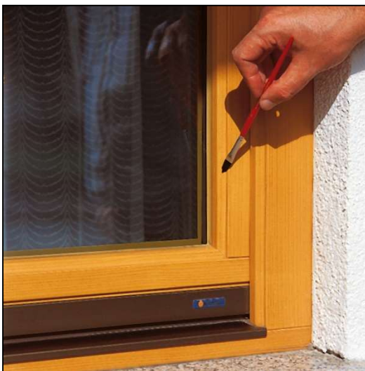
Abb. 4.1: Ausbesserung von Schäden