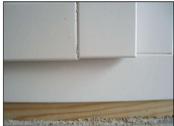
Abb. 3.3: Geöffnete V-Fuge

Extreme Feuchtwechsel bewirken starkes Quellen und Schwinden. Solche Dimensionsänderungen können zu offenen V-Fugen führen. Sollten sich Fugen öffnen sind diese mit ADLER V-Fugensiegel zu verschließen.