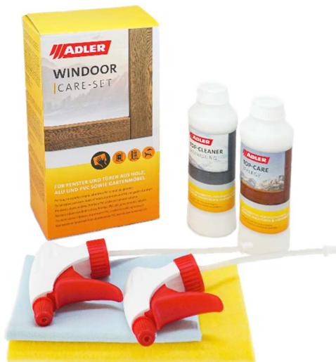
Abb. 2.1: Windoor Care-Set

Das ADLER Windoor Care-Set, besteht aus ADLER Top-Cleaner, ADLER Top-Care, zwei Reinigungstüchern und zwei Sprühköpfen (Abb. 2.1).