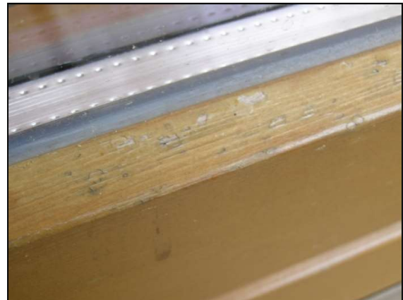
Abb. 3.1: Hagelschaden am Fenster

Wichtig ist die regelmäßige visuelle Begutachtung der Beschichtung durch den Endkunden. Mindestens einmal pro Jahr müssen die Fenster auf Beschädigungen hin kontrolliert werden. Durch eine rasche und einfache Reparatur kleiner mechanischer Schäden, welche im Zuge der Bauphase oder durch Hagelschlag (Abb. 3.1) entstanden sind, können umfangreiche Spätschäden einfach verhindert werden. Darüber müssen die Hersteller der Fenster oder Haustüren ihre Kunden unbedingt hinweisen.