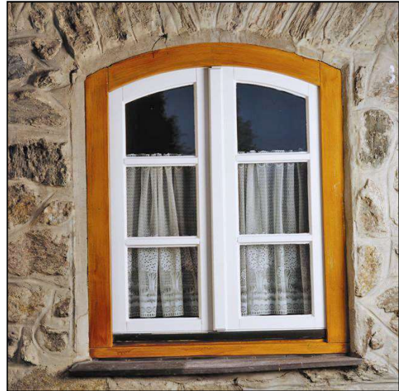
Abb. 4.3: Nach Renovierungsanstrich