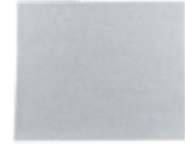
Finishpapier Bogen 3M